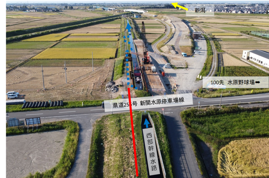
仮水路φ900 第1回施工 赤破線 L=100m 第2回施工 赤線

第1回止水のお願いにて下記航空写真の青点線箇所の仮水路（φ900）を施工し、カルバート工（102mのうち55m完了）を施工しました。残りのカルバート工をするに際し、下記航空写真の赤線箇所の仮水路（φ900）を施工する必要があり、再度、止水をお願い致します。今回、期間が長いのは一部漏水があり、修理が必要になった為です。大変ご迷惑をお掛け致しますが、ご協力をお願い致します。